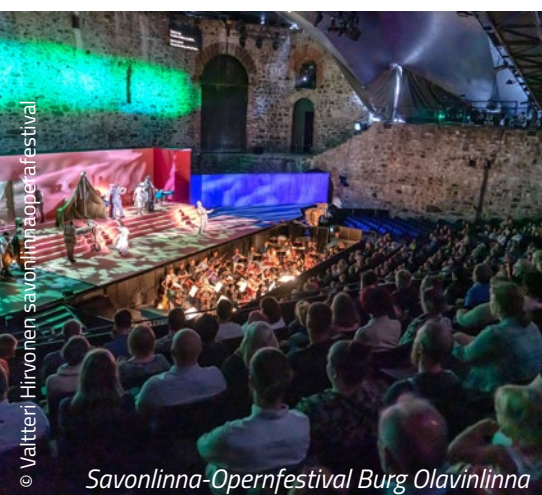
Savonlinna-Opernfestival Burg Olavinlinna