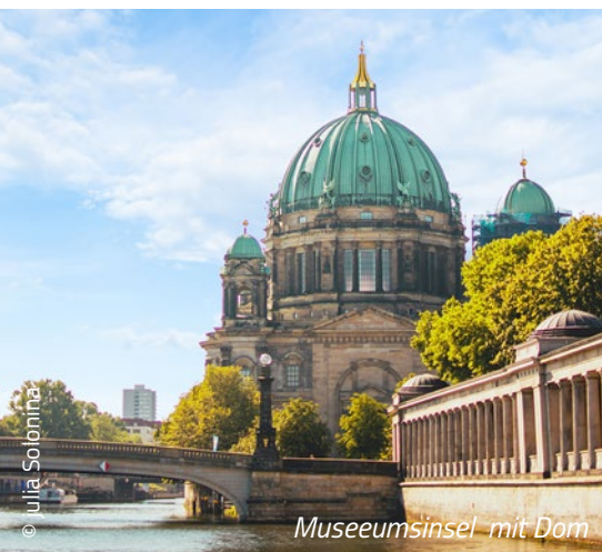
Museumsinsel mit Dom