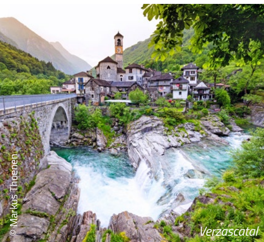
Italien Isola Bella on Lago Maggiore