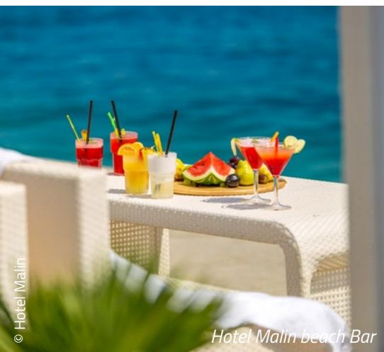
Hotel Malin beach Bar

Ulla Keienburg Globetrotter Reisebegleitung