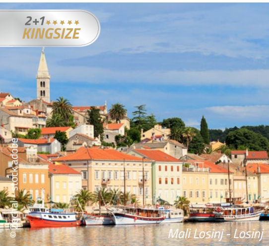
Mali Losinj - Losinj