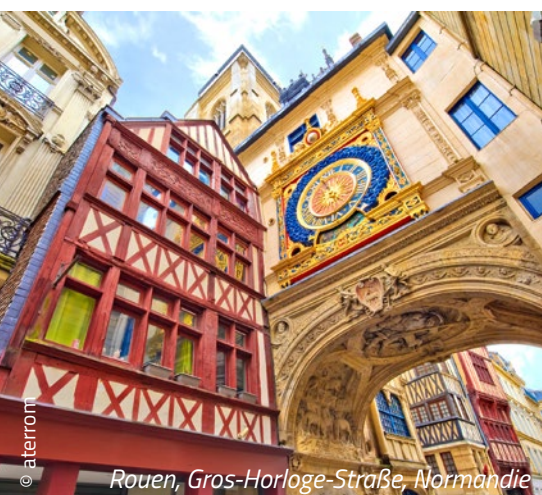
Rouen, Gros-Horloge-Straße, Normandie