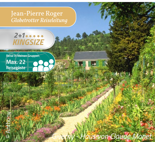
Giverny – Haus von Claude Monet

Reise in kleinen Gruppen Max. 22 Reisegäste