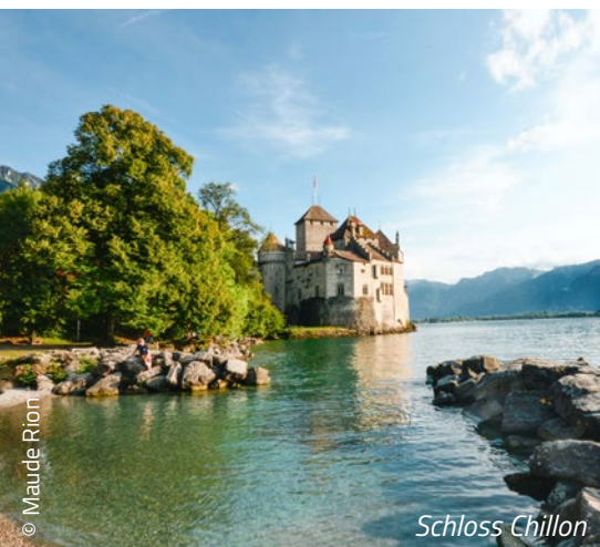
Montreux am Genfer See