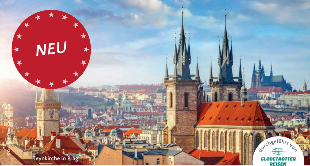
Teynkirche in Prag