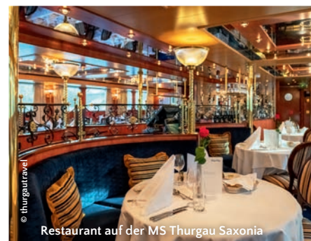
Restaurant auf der MS Thurgau Saxonia