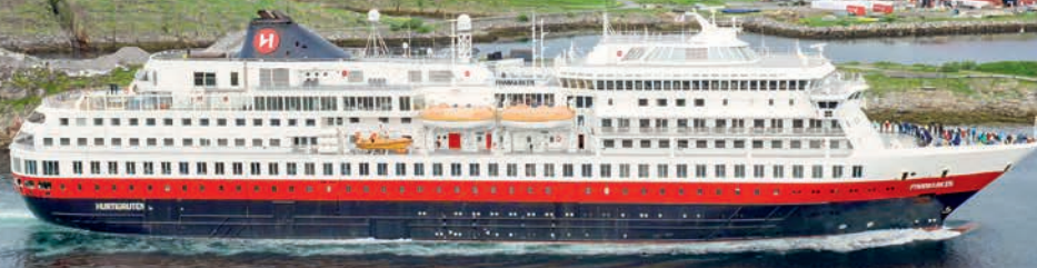
MS Finnmarken in Træna