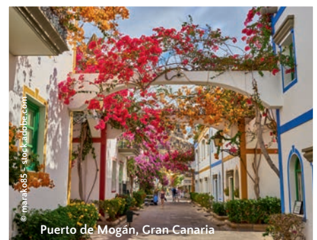
Puerto de Mogán, Gran Canaria

Bitte gültigen Reisepass mitführen. Globetrotter Premiumschutz ab 5,2% des Reisepreises