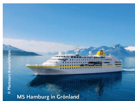
MS Hamburg in Grönland