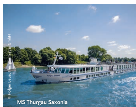
MS Thurgau Saxonia