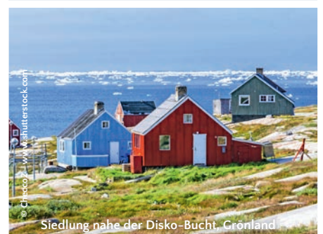
Siedlung nahe der Disko-Bucht, Grönland