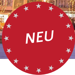
Weihnachtsmarkt am Kléberplatz in Straßburg