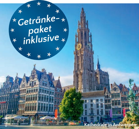
Kathedrale in Antwerpen