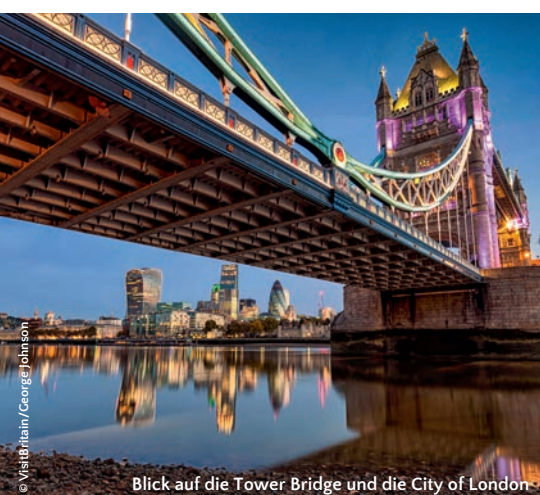
Blick auf die Tower Bridge und die City of London