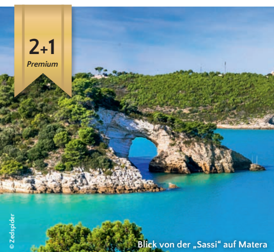
Blick von der „Sassi“ auf Matera