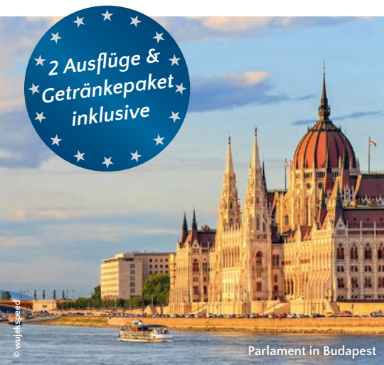
Parlament in Budapest