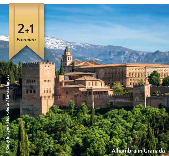
Alhambra in Granada