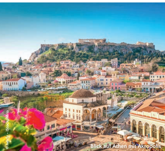
Blick auf Athen mit Akropolis