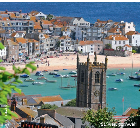
St. Ives, Cornwall