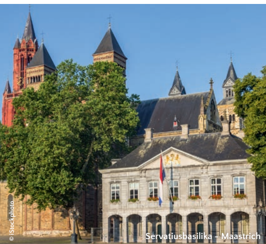
Servatiusbasilika – Maastricht