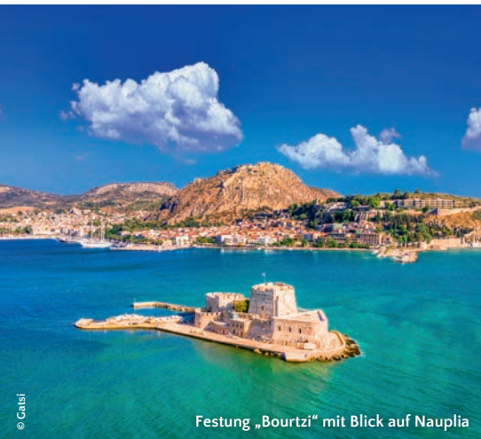
Festung „Bourtzi“ mit Blick auf Nauplia