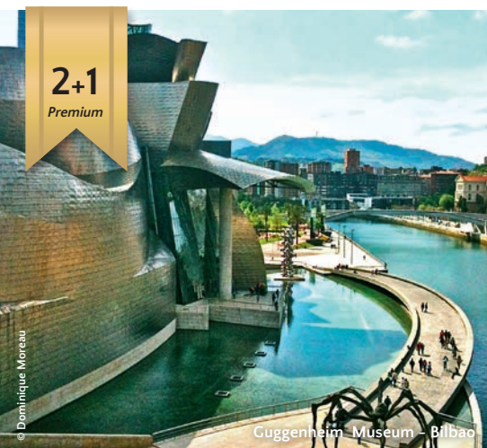
Guggenheim Museum – Bilbao