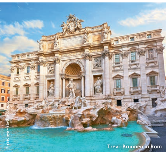
Trevi-Brunnen in Rom