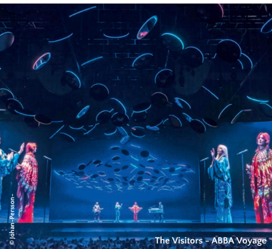
The Visitors – ABBA Voyage