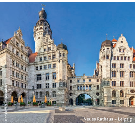
Neues Rathaus – Leipzig