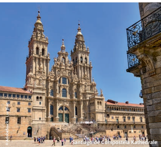
Santiago de Compostela Kathedrale