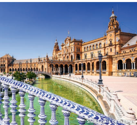
Sevilla Plaza de España