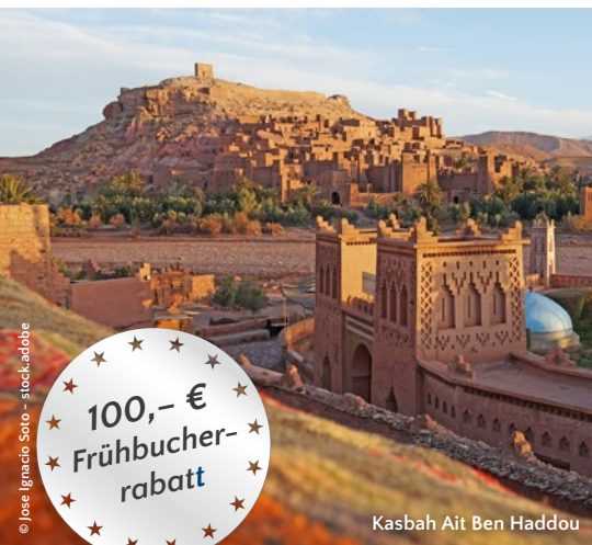
Kasbah Ait Ben Haddou