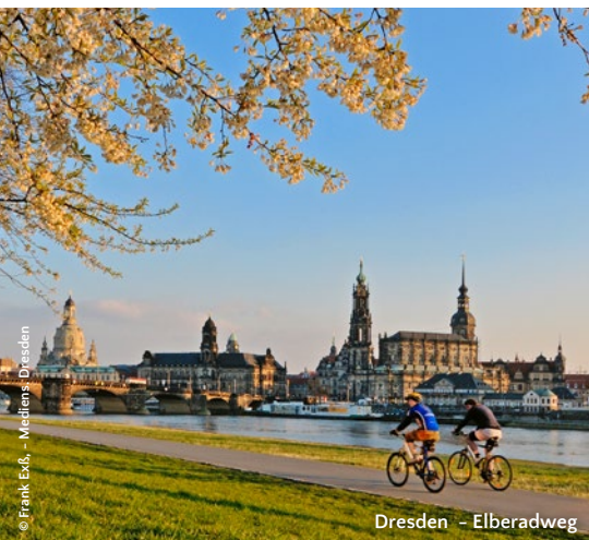
Dresden – Elberadweg