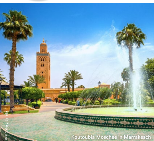
Koutoubia Moschee in Marrakesch