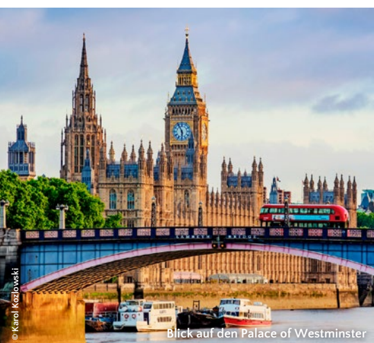
Blick auf den Palace of Westminster