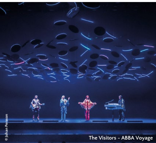
The Visitors - ABBA Voyage