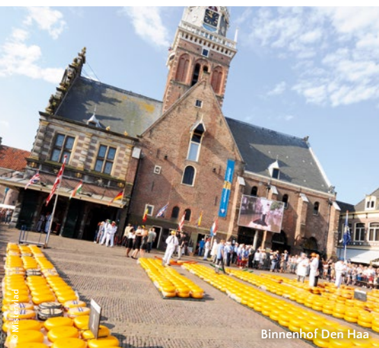
Binnenhof Den Haag