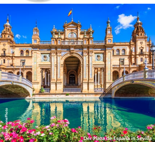
Der Plaza de España in Sevilla