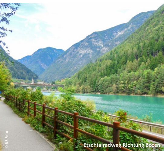
Etschtalradweg Richtung Bozen