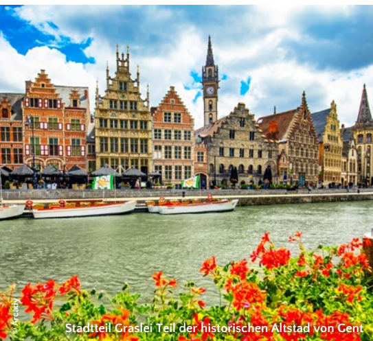
Stadtteil Graslei Teil der historischen Altstadt von Gent