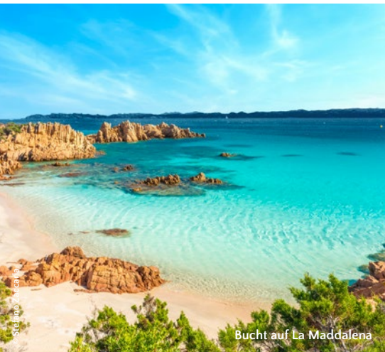
Bucht auf La Maddalena