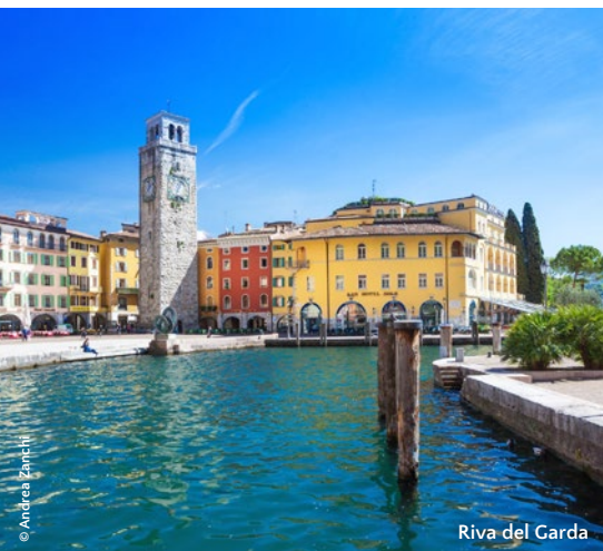
Riva del Garda

Einzelzimmer zzgl. 299,- € Doppelzimmer zur Alleinbenutzung zzgl. 449,- € Neubauer Premium-Schutz ab 55,- €