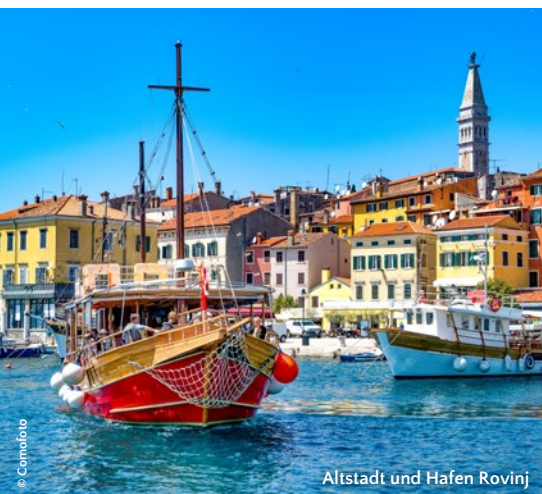
Altstadt und Hafen Rovinj