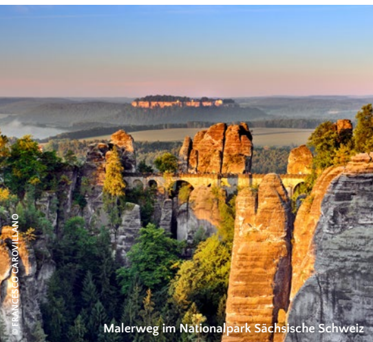
Malerweg im Nationalpark Sächsische Schweiz