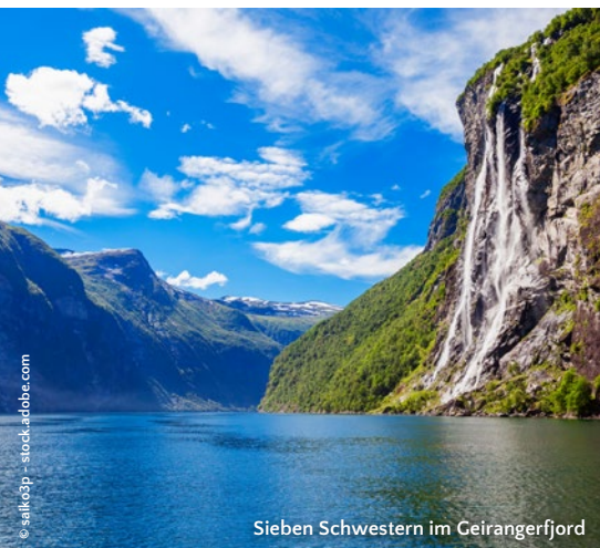
Sieben Schwestern im Geirangerfjord