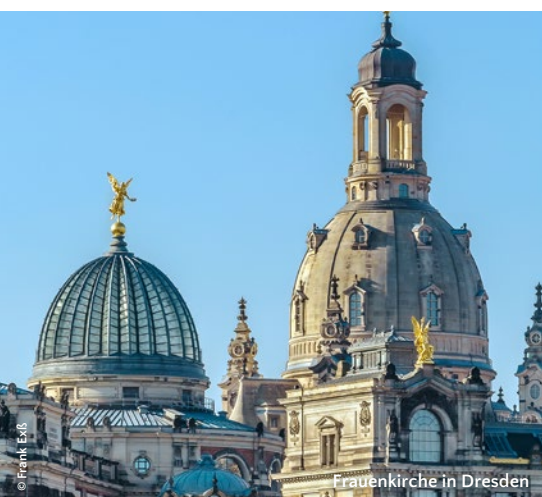
Frauenkirche in Dresden