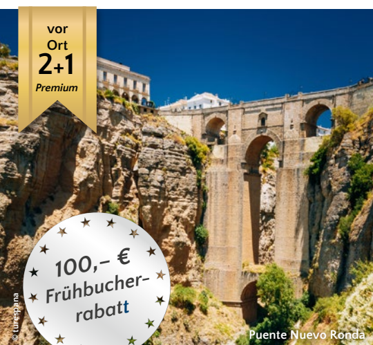
Puente Nuevo Ronda