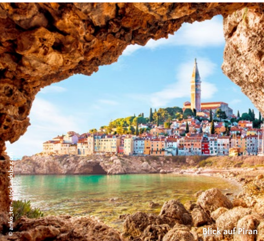
Blick auf Piran